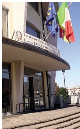
Il Federici di Trescore