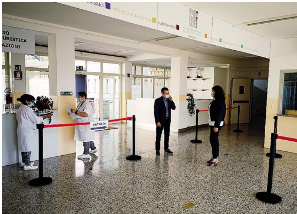
L'ingresso dell'Istituto Serafino Riva di Sarnico con la nuova segnaletica e i percorsi differenziati